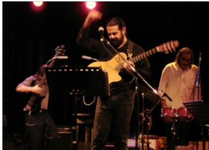
1 de 2

Neuquén > Si hay algo que el mundo le reconoce a Adrián Goizueta es haber renovado la canción latinoamericana contemporánea, trabajo logrado a través de la constante experimentación. Una búsqueda que lo llevó hasta lo que él mismo llama "música popular elaborada": una suerte de nuevo género inabarcable, un amasijo compacto y a la vez flexible que mixtura tango, jazz, folklore y lo sinfónico, dándoles un sonido particular y único.