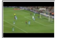
Visto bueno a Renault p 05 de Diciembre