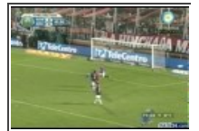
Newells 0 - Boca 1 Los g 23 de Agosto