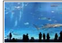
v5 05 de Diciembre