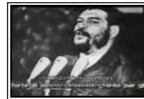
El Che Guevara 20 de Octubre