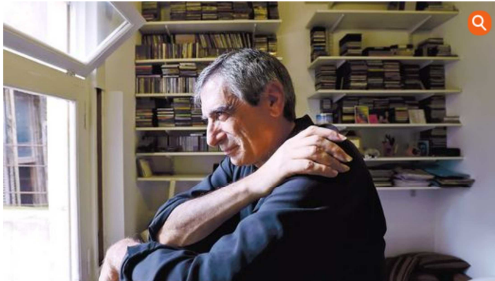
Pensativo El guitarrista, en su estudio de San Telmo. Ahora prefiere crear antes que enseñar.

0 Twitter < 10 Recomendar < 447 Compartir