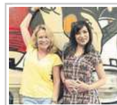
Soledad Silveyra & Claribel Medina: el vínculo menos pensado