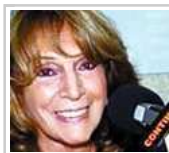
Cómo fue el 2013 de ella