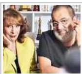
Magdalena y Lanata: La fórmula para 2014